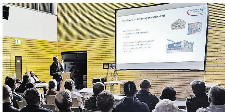
Staubbelastung, Lkw-Verkehr und Kosten, es gab viele Fragen.

Beier wies außerdem darauf hin, dass man im Zuge all der anfallenden Arbeiten auch die Freileitungen und Dachständer überprüfen wolle, um diese dann wenn möglich abzubauen.