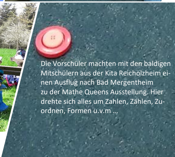
Die Vorschüler machten mit den baldigen Mitschülern aus der Kita Reicholzheim einen Ausflug nach Bad Mergentheim zu der Mathe Queens Ausstellung. Hier drehte sich alles um Zahlen, Zählen, Zuordnen, Formen u.v.m ...