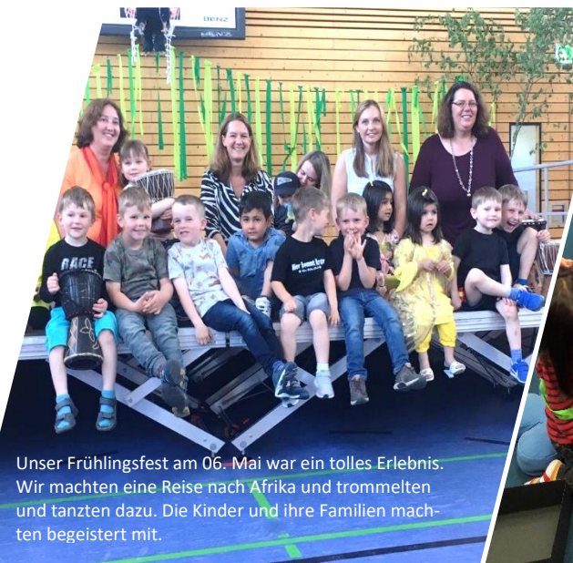
Unser Frühlingsfest am 06. Mai war ein tolles Erlebnis. Wir machten eine Reise nach Afrika und trommelten und tanzten dazu. Die Kinder und ihre Familien machten begeistert mit.

So schnell ist die Zeit schon wieder vergangen und vieles haben wir wieder erlebt. Deshalb möchten wir Ihnen heute einen kleinen Einblick in unseren Kindergartenalltag mit unserer Bildergalerie bieten. Viel Spaß dabei.