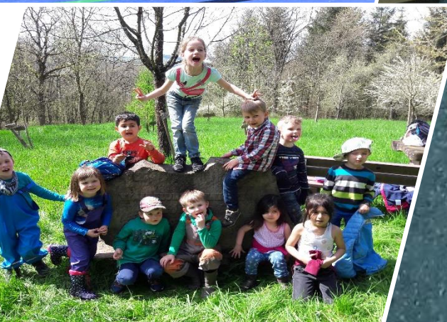
Wir waren wieder viel in Wald und Feld unterwegs und hatten schöne Erlebnisse in der Natur.