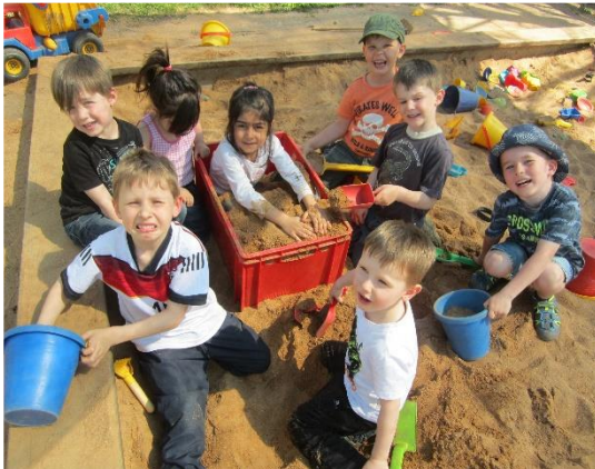
Experimente sind immer sehr beliebt und wecken die Neugierde und das Interesse der Kinder.