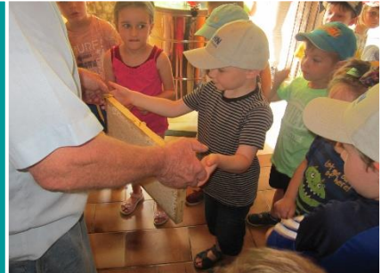
Wir sind natürlich gerne der Einladung gefolgt! Es war ein sehr interessanter Ausflug - nicht nur für die Kinder...! Zum Abschluss gab es auch noch leckere Honigbrote zum Probieren und Stärken ehe es wieder zurück in den Kindergarten ging.