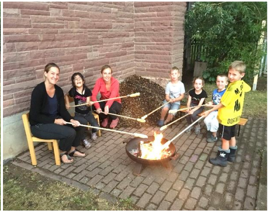
Ein Highlight war sicherlich für die Großen die Übernachtung im Kindergarten!